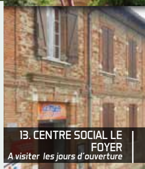
13. CENTRE SOCIAL LE FOYER A visiter les jours d'ouverture