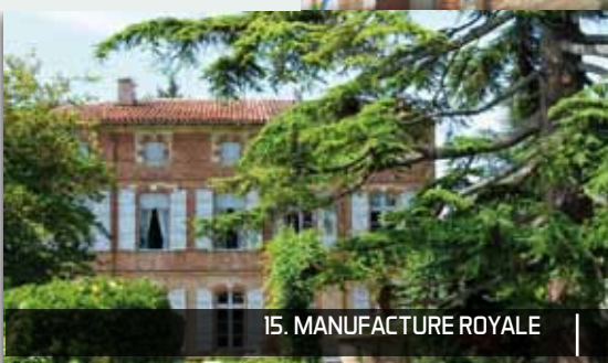
15. MANUFACTURE ROYALE