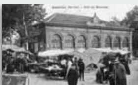
6. ANCIEN MARCHÉ COUVERT AUJOURD'HUI CINÉMA

6 Face à cette maison se trouve L'ANCIEN MARCHÉ COUVERT TRANSFORMÉ EN SALLE DE CINÉMA « l'Oustal » . Vous remarquerez aussi la petite bâtisse des poids publics .