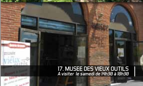
17. MUSÉE DES VIEUX OUTILS A visiter le samedi de 14h30 à 18h30