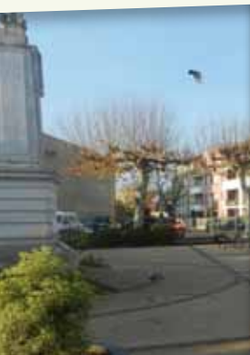
2. PLACE DU MARÉCHAL DELATTRE DE TASSIGNY

1 DÉPART : Office de Tourisme, esplanade de la Madeleine où vous pouvez garer votre voiture. Parcours de 3kms, prévoir 1 heure environ pour cette visite historique de la ville.