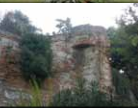
8. TOUR CAMBOLAS