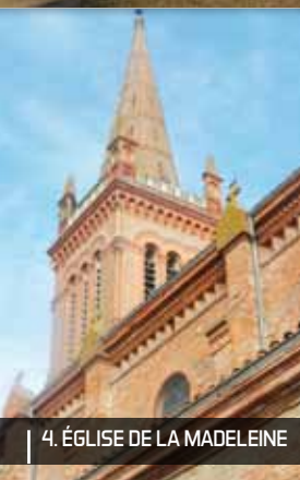
4. ÉGLISE DE LA MADELEINE

4 Poursuivre dans la rue Jean-Jaurès en direction du pont, puis prenez à droite, la rue François-Albert, ancienne « percée » reliant le cimetière à L'ÉGLISE DE LA MADELEINE du XIX ème siècle.