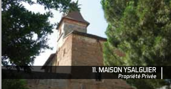
11. MAISON YSALGUIER Propriété Privée

Pour aller plus loin : découverte de la Fondation Pous, haut lieu de la peinture à Auterive située route de Grépiac (sur RDV) : 05 61 08 34 03 / www.fondationpous.org