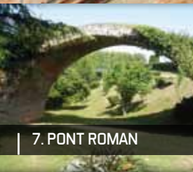
7. PONT ROMAN

10 Prenez à droite la rue Anatole-France jusqu'au n° 19 qui était LA MAISON DU COMTE (XVI-XVII ème siècle).