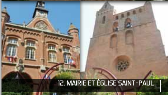
12. MAIRIE ET ÉGLISE SAINT-PAUL