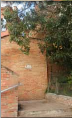
9. PORTE NEUVE