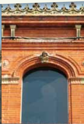
3. LES CARIATIDES

2 Face à l'office, montez sur votre gauche, vous découvrirez la PLACE DU MARÉCHAL-DELATTRE DE-TASSIGNY où fut créé, au XVIII ème siècle, le second cimetière d'Auterive.